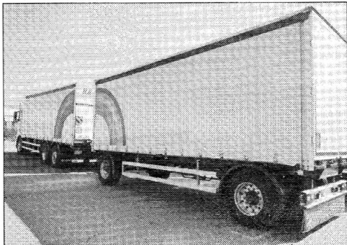
Sein LKW mit Regenbogen

Barlocci GmbH Riedackerstrasse 7d 8153 Rümlang Tel: 044 861 01 05 / Fax: 044 861 01 14 www.barlocci.ch / kontakt@barlocci.ch